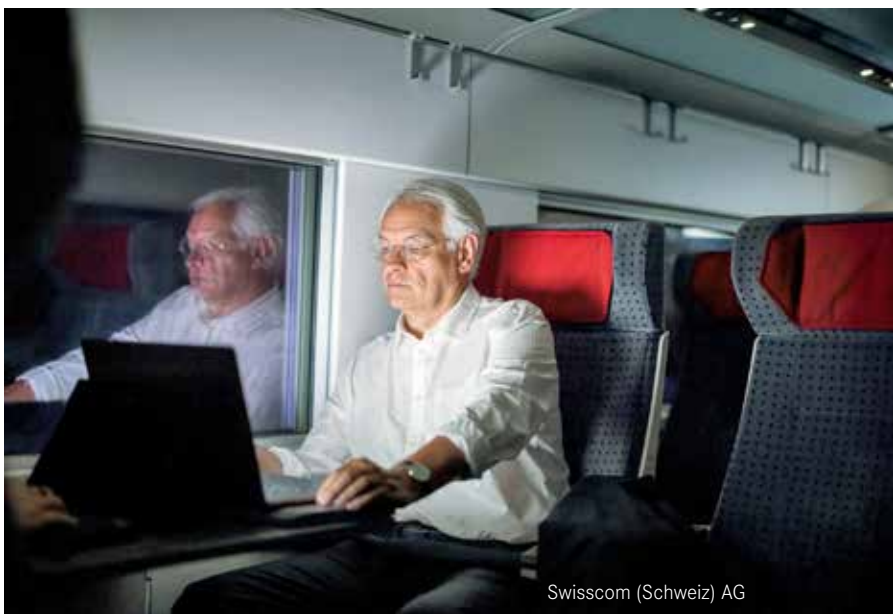
Swisscom (Schweiz) AG