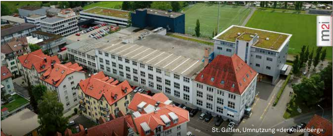
St. Gallen, Umnutzung «derKellenberg»

SCHMERIKON: Verkauf & Service Renault Trucks/Volvo Trucks, Service Van Hool, Mercedes-Benz Trucks/Vans/Setra Omnibusse/Unimog/OMNIplus/MAN BusTopService/FUSO. CHUR: Verkauf & Service Renault Trucks/Volvo Trucks/IVECO Daily, Service IVECO/Volvo Bus/Van Hool/Boschung. FRAUENFELD: Verkauf & Service Renault Trucks/Van Hool. ARBON: Verkauf & Service Renault Trucks/VDL Bus & Coach, Service Van Hool.